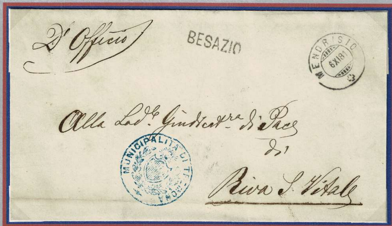
Lettera del 1881 con annullo lineare in partenza BESAZIO , annullo della Municipalità di Tremona e transitata da Mendrisio.