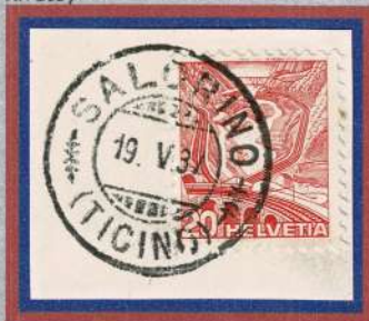
Annullo SALORINO , 1937.