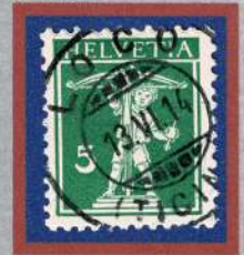
Annullo LOCO , 1914.