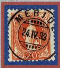
Annullo MERIDE , 1899.