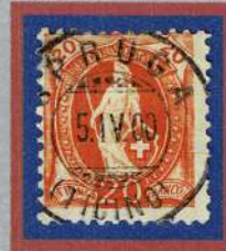
Annullo SPRUGA , 1900.

Lettera del 1896 con annullo lineare in partenza SPRUGA (TESSIN) e transitata da Comologno.